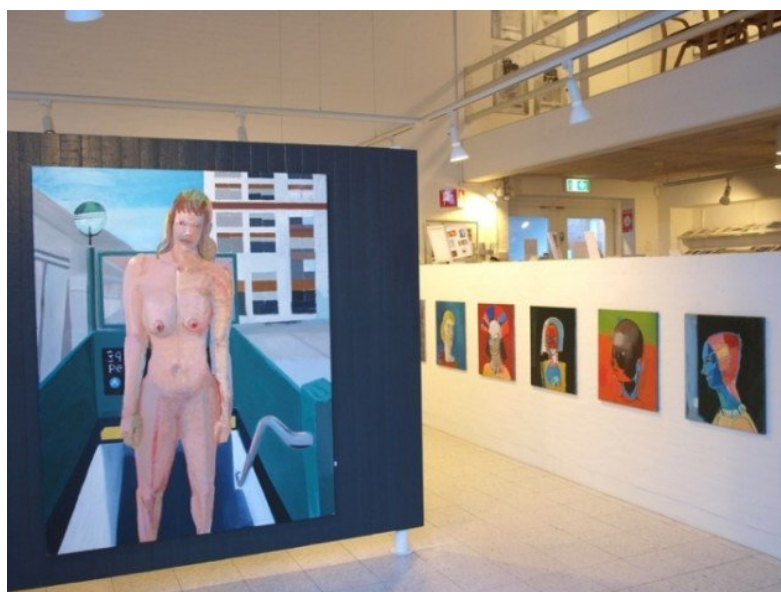
Udstillingsview fra Bjørn Eriksen: Den syvende bevidsthed. Pressefoto