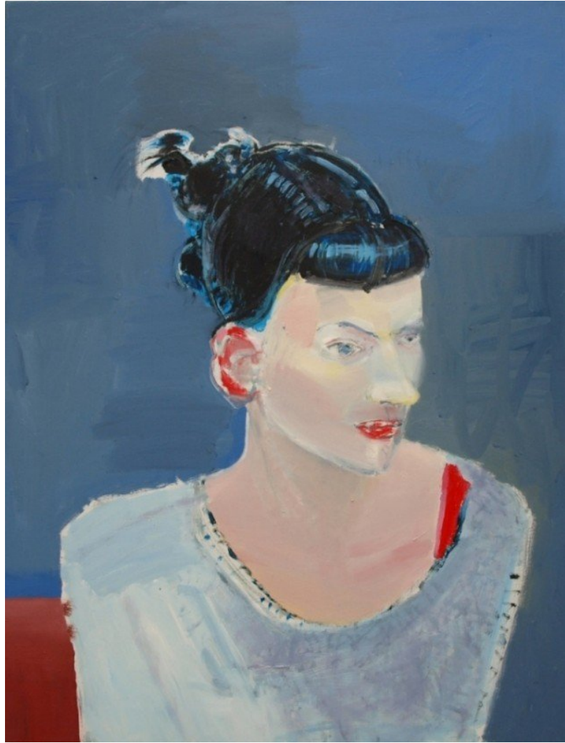
Bjørn Eriksen: Princess, 2012.