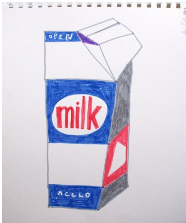
Jonna Pedersen: Alverdens mælkekartoner, 2012. Pressefoto