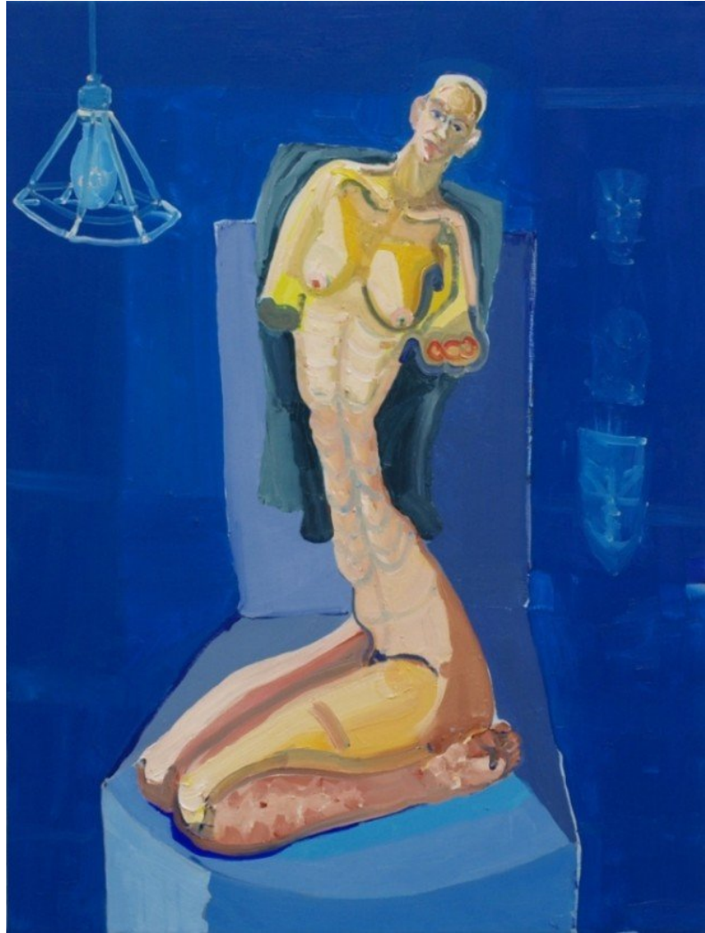
Bjørn Eriksen: Long Tall Sally, 2012.