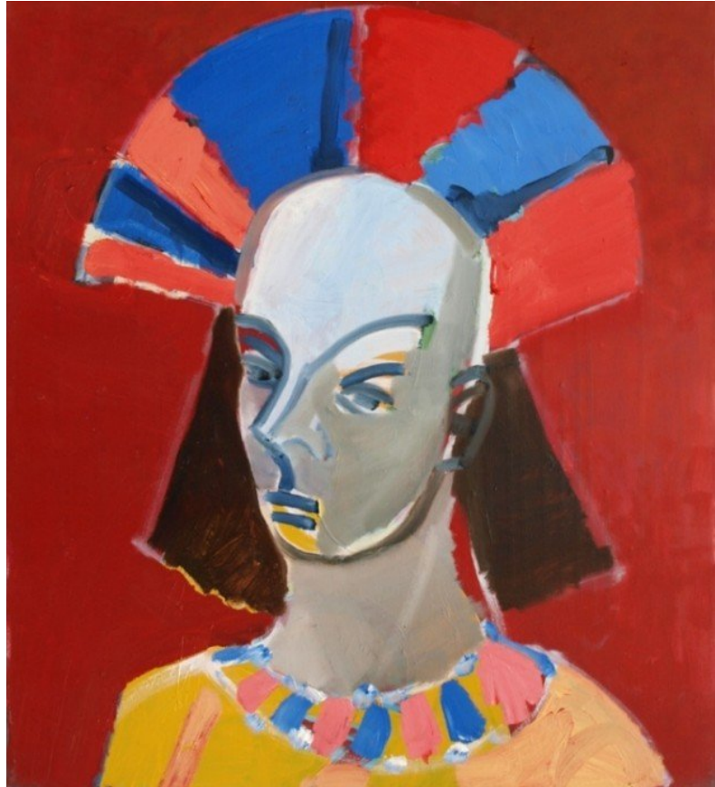
Bjørn Eriksen: Syveren, 2012. Pressefoto