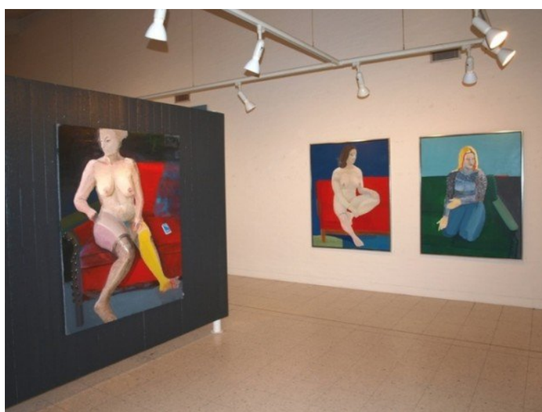
Udstillingsview fra Bjørn Eriksen: Den syvende bevidsthed. Pressefoto