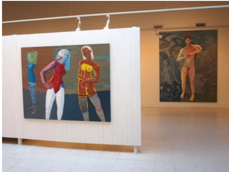
Udstillingsview fra Bjørn Eriksen: Den syvende bevidsthed.