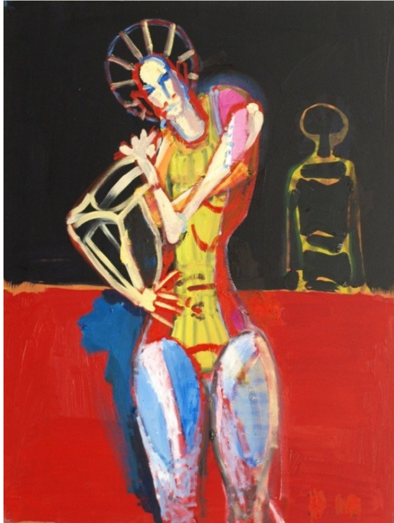
Bjørn Eriksen: Skyggespejlet, 2012. Pressefoto