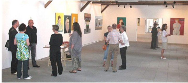
Udstillingsview, Kunstpakhuset.